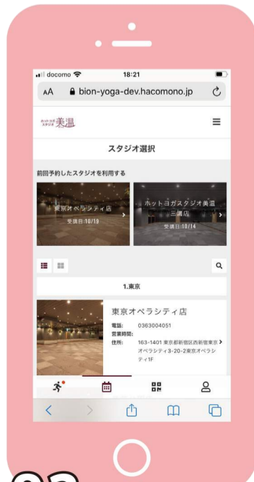
02 予約サイトに登録