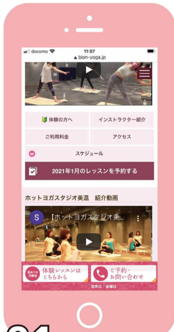
01 レッスン予約をクリック