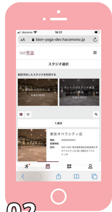
02 予約サイトに登録