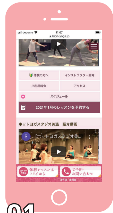
01 レッスン予約をクリック